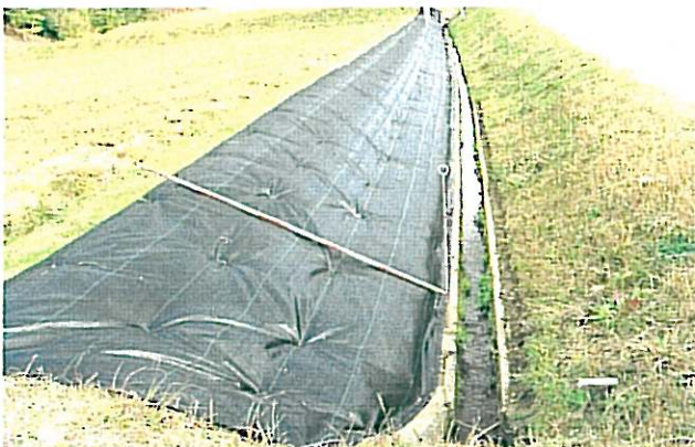
防草シートの敷設後