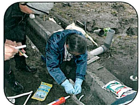
目地補修 順序よく進めることが鍵ですね！