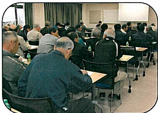
研修会場にて 沢山の参加があり、満員状態です！