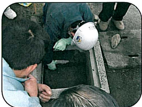
人気の高い「水中バテ」 水路補修の強い味方ですね