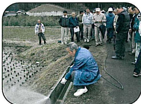
まずは洗浄！ 一気に汚れを除去します！