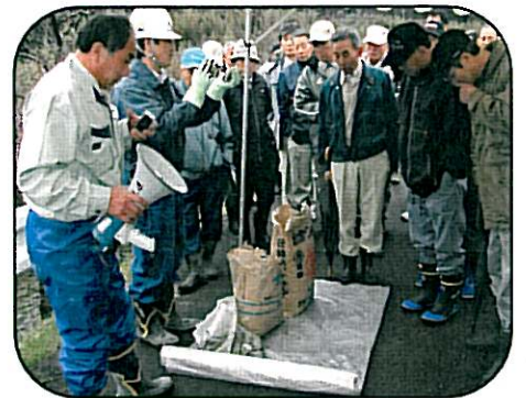
こんな工法もあります… みなさん熱心に聞き入ってます！